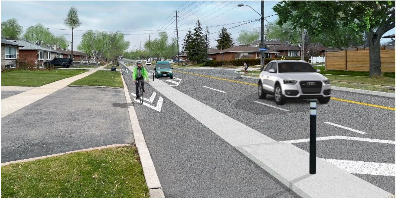
An artist's rendering of proposed road safety improvements on Scarborough Golf Club Road at Greenrock Avenue looking north, including a protected cycle track.

The City of Toronto is inviting residents to learn more and provide feedback on proposed changes to Scarborough Golf Club Road from Ellesmere Road to Kingston Road, including road safety improvements, bikeways, and other complete street features.